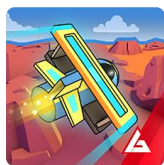
FLY SKY HIGH