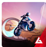
GRAVITY RIDER ZERO