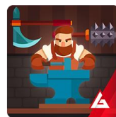
GEAR FOR HEROES

Strategia Vivid Games na najbliższe 12 miesięcy zakłada m.in. rozwój i dywersyfikację portfela produktów, rozbudowę sieci dystrybucji o nowe kanały i platformy sprzętowe, oraz rozwój nowych linii biznesowych.