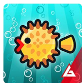
IDLE FISH AQUARIUM